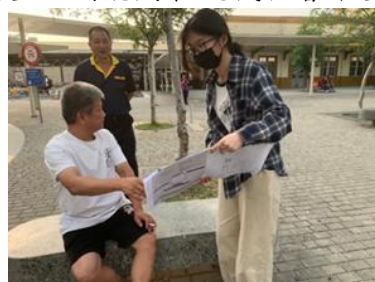
學生於火車站前進行採訪意見收集