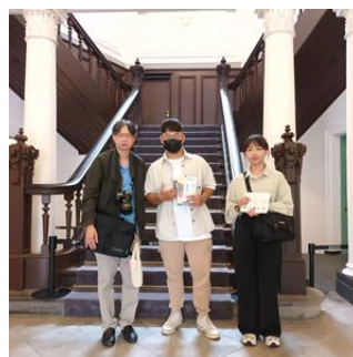
師生於鐵道博物園區合影