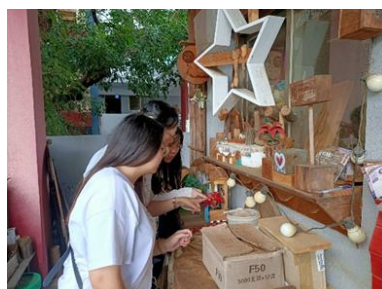
學生在台南文創園區欣賞木雕