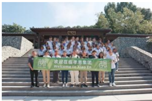
學生至馬來西亞孝恩集團實習

從上述案例中，可得知學生藉由導師帶領參加珍珠學生計畫後，他們自認已蛻變了不少，並成功提升自信心，並激發出其解決問題之能力。而這些皆是推動培育珍珠學生計畫之成效，亦為本處將會持續推動該計畫之原因。