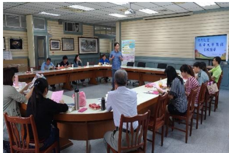
招收弱勢學生情形

進行弱勢助學宣導活動，辦理各地區（基隆區、新北區、苗栗區、台中區、南投區、嘉義區、雲林區、台南區、高雄區、屏東區、台東區）校長座談會，參加的人員有高中職端校長、秘書、行政主管、高三導師及高三同學，活動總共辦理了 242 場次，參加的同學超過 9,000 人次。