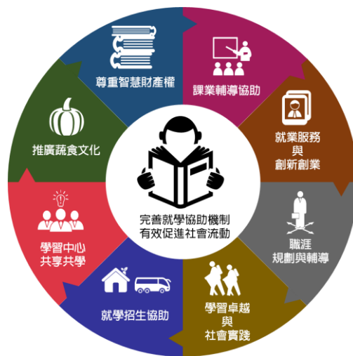
經濟不利學生輔導措施

學生可依自身課程進度及學習需求，自主選擇參與相關活動，於課餘時間投入學習，藉由學習成果獲得獎助金，以取代外出打工之需求，降低時間與經濟壓力，讓學生得以專注學習、提升能力與自我成長。期望經濟不利學生在本校支持下，培養知識素養、生活態度與社會關懷精神，得以「畢業即就業」，並於未來具備回饋社會之能力與力量。